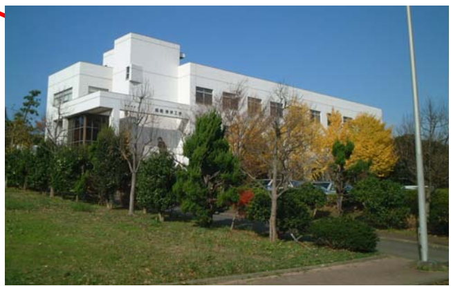
横浜国立大学 工学部船舶海洋工学棟 2階